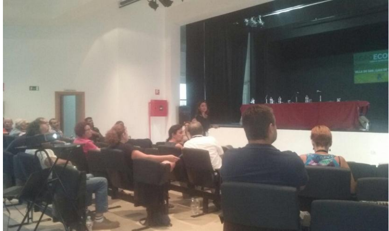
Presentación del trabajo