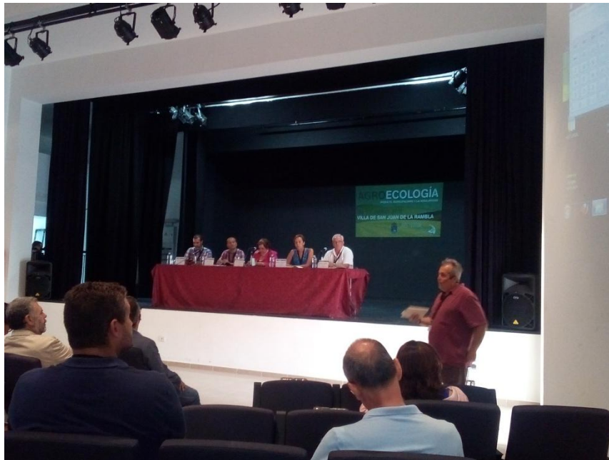
Mesa redonda de Responsables políticos municipales

Estas son algunas imágenes de las experiencias visitadas dentro de las jornadas que han sido una convivencia de dos días, de las que sin duda han surgido lazos para la colaboración intermunicipal.