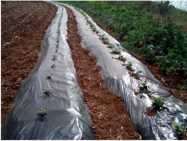
Visita a finca de hortalizas