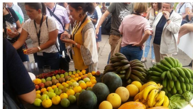
Muestra de productos locales y degustaciones