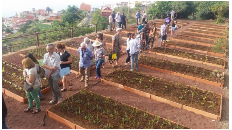
Finca escuela del Ayuntamiento de San Juan